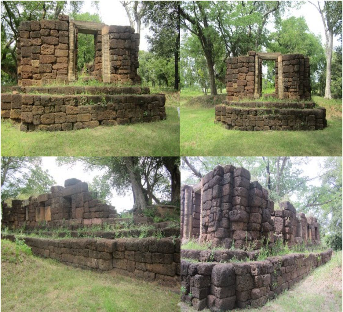
ภาพประกอบ 2.3 ปราสาทห้วยแคน

ปราสาทห้วยแคน ตั้งอยู่ที่หมู่ที่ 1 บ้านห้วยแคน ตำบลห้วยแคน อำเภอห้วยแถลง จังหวัดนครราชสีมา เป็นโบราณสถานขนาดเล็ก สร้างด้วยหินศิลาแลง จำนวน 2 หลัง หันหน้าไปทางทิศตะวันออก มีประตูทางเข้าด้านหน้าเพียงประตูเดียว ผนังอาคารทางด้านทิศใต้เจาะช่องหน้าต่าง ส่วนผนังทางทิศเหนือ